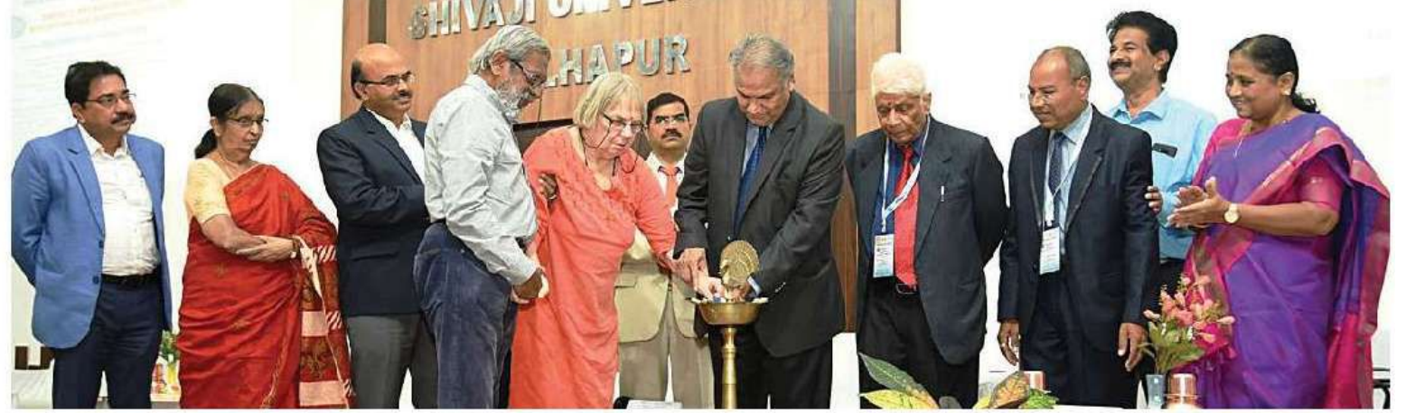
कोल्हापूर : समाजशास्त्र विभागाच्या परिषदेच्या उद्घाटनप्रसंगी उपस्थित मान्यवर.

शिवाजी विद्यापीठाच्या समाजशास्त्र विभागामार्फत अधिविभागाच्या सुवर्णमहोत्सव वर्षाचे औचित्य साधून रशियन सोशओलॉजिकल सोसायटी, साऊथ आफ्रिकन सोशओलॉजिकल सोसायटी, एशिया क्लायमेट चेंज एज्युकेशन सेंटर, साऊथ कोरिया, इंटरनॅशनल सोशओलॉजिकल सोसायटी आणि इंडियन सोशओलॉजिकल सोसायटी यांच्या सहकार्याने विद्यापीठाच्या राजर्षी शाहू सिनेट सभागृहामध्ये 'समाज : पुनर्रचना, प्रतिक्रिया आणि जबाबदारी' या विषयावर तीनदिवसीय आंतरराष्ट्रीय