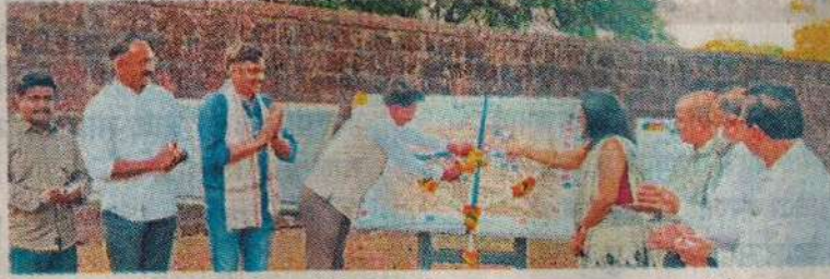
पन्हाळा : डिजिटल हेरिटेज ऑडिओ गाईड उपक्रमाच्या उद्घाटनप्रसंगी मान्यवर.