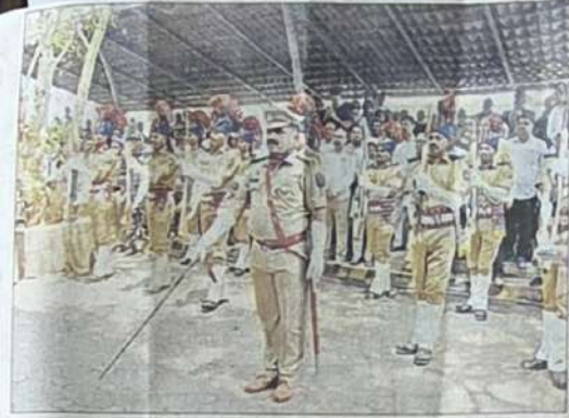
कोल्हापूर : पोलिस दलाने शिस्तबद्ध संचलनासह खंदुकीतून तीन राऊंड फायर करत शासकीय मानवंदना दिली.