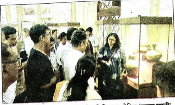
कोल्हापूर : जागतिक वस्तुसंग्रहालय दिनानिमित्त आयोजित 'वारसा सफरी' उपक्रमांतर्गत कोल्हापूरच्या इतिहासाची माहिती देताना मान्यवर.

टाऊन हॉल वस्तुसंग्रहालय येथे सकाळी ११.३० ते दुपारी १.३० या वेळेत पार पडलेल्या या वारसा सफरीत संशोधक विद्यार्थी, इतिहासप्रेमी, अभ्यासक आणि नागरिकांनी मोठ्या संख्येने सहभाग नोंदविला. यावेळी संग्रहालयातील छत्रपती शाहू महाराज काळातील तसेच