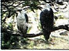
कोल्हापूर : शिवाजी विद्यापीठात आढळलेली पांढऱ्या पोटाच्या समुद्री गरुडाची जोडी.