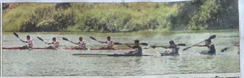
सांगली : अखिल भारतीय आंतरविद्यापीठ कयाकिंग व कॅनॉईंग स्पर्धेतील चिंतधरारक क्षण.