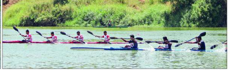
सांगली : अखिल भारतीय आंतरविद्यापीठ कयाकिंग व कॅनॉईंग स्पर्धेतील चित्तथरारक क्षण.