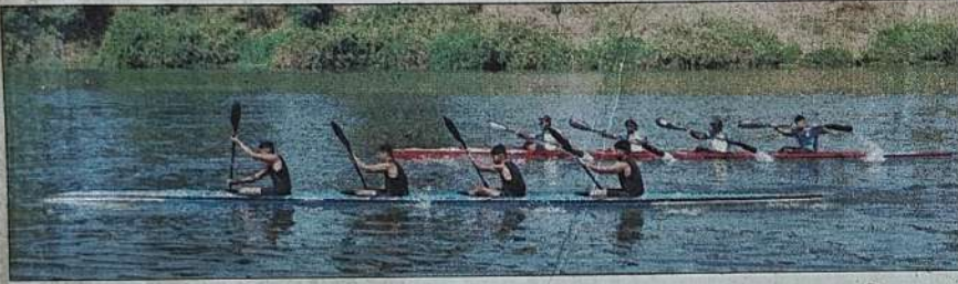
सांगली : आंतरविद्यापीठ कयाकिंग स्पर्धेतील एक क्षण.

ना. चंद्रकांत पाटील यांचे आवाहन; कनोईंग, कयाकिंग स्पर्धांचा प्रारंभ