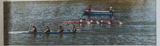
स्पर्धा स्थळाची खास वैशिष्ट्ये