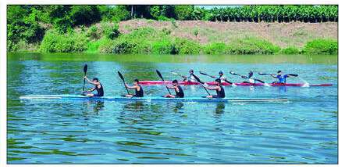
सांगली : आंतरविद्यापीठ कयाकिंग स्पर्धेतील एक क्षण.