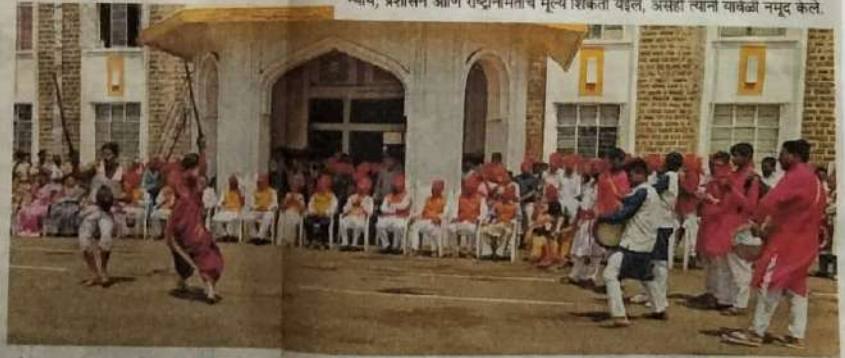
कोल्हापूर : शिवराज्याभिषेक दिनांिमित्त शिवाजी विद्यापीठात मान्यवरांसमोर मराठी खेळांची चित्तचरारक प्रात्यक्षिके सादर करताना वेंगळूळ (ता. भुदरगड) येथील सव्यसाधि गुलकुलमच्या कलाकारांचे पथक.