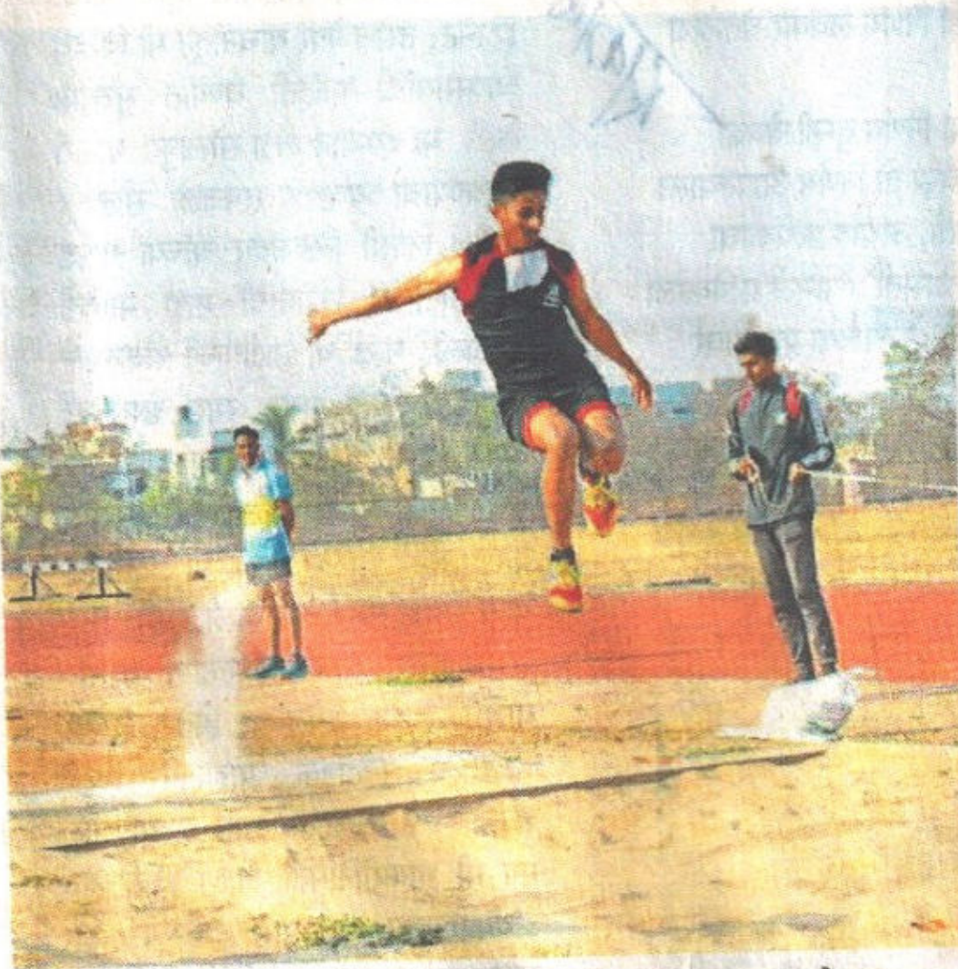
कोल्हापूर : शिवाजी विद्यापीठात बुधवारी शिवस्पंदन महोत्सवात झालेल्या लांबउडी स्पर्धेतील क्षण.

अंतिम फेरीसाठी तंत्रज्ञान अधिविभाग विरुद्ध गणित अधिविभाग यांच्यात गुरुवारी सामना होणार आहे. कबड्डी पुरुष प्रकारात तंत्रज्ञान अधिविभाग, क्रीडा, वाय.सी.आर. डी.सी. आणि एमबीए अधिविभाग हे संघ उपांत्य फेरीसाठी पात्र ठरले आहेत.