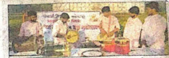
कोल्हापूर : शिवाजी विद्यापीठात लोकवाद्य महोत्सवा अंतर्गत वाद्यांचे सादरीकरण करताना विद्यार्थी.