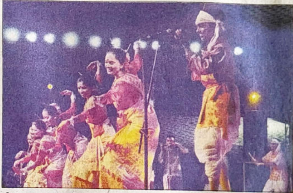
कोल्हापूर : दसरा महोत्सवात केरळा नटनम नृत्य सादर करताना कलाकार.