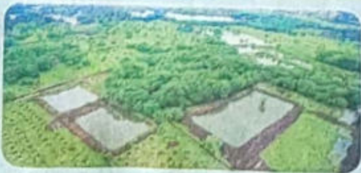
रेन वॉटर हार्वेस्टिंगद्वारे पाण्याची साठवण.