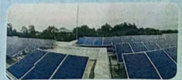
विद्यापीठातील सौरऊर्जा प्रकल्प