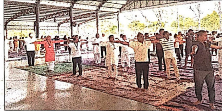
शिवाजी विद्यापीठात योगासने करताना अधिकारी, शिक्षक, कर्मचारी, नागरिक.

मन, बुद्धी आणि भावना यांचा सुंदर मिलाप होऊन जीवनातील यशस्वीता सिद्ध होण्याकरता योग उपयोगी पडतो. योग आणि प्राणायाम जीवन निरामय सुंदर व आनंदी राखून संपन्न करता येते