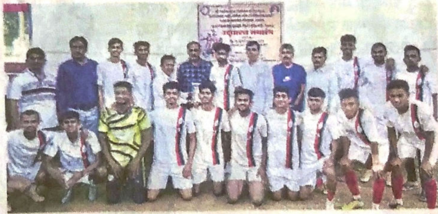
कोल्हापूर : शिवाजी विद्यापीठ आंतरविभागीय फुटबॉल स्पर्धेतील शहाजी महाविद्यालयाचा विजेता संघ.