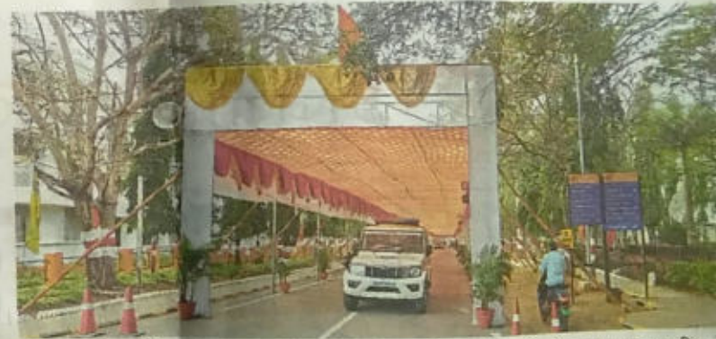
कोल्हापूर : शिवाजी विद्यापीठात उद्या (सोमवारी) होणाऱ्या दीक्षान्त मिरवणुकीसाठी स्वागत कमान उभारली आहे.

दरम्यान, ज्या विद्यार्थ्यांनी पदवी प्रमाणपत्रासाठी अर्ज भरताना समक्ष असा विकल्प निवडला आहे. त्यांची पदवी प्रमाणपत्रे विद्यापीठात दीक्षान्त समारंभादिवशी सकाळी साडेसात ते अकरा आणि समारंभ संपल्यानंतर सायंकाळी सहावाजेपर्यंत वितरित केली जाणार आहेत. या विद्यार्थ्यांना प्रमाणपत्र वितरित केल्या जाणाऱ्या बूथचा क्रमांक एसएमएसद्वारे परीक्षा मंडळाकडून कळविला आहे.