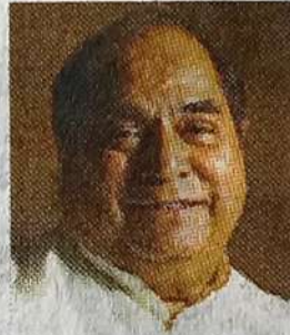
डी. वाय. पाटील