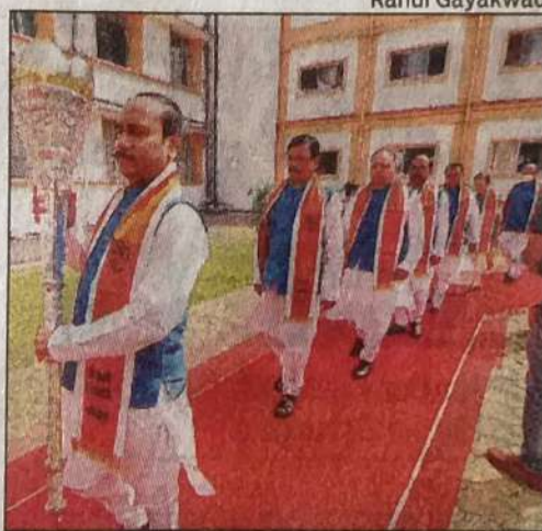
Convocation procession taken out on the premises of the Shivaji University on Saturday morning

male students (32,520) receiving their degree certificates was more than the number of male students (29,840).