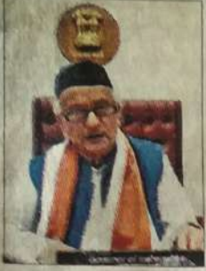
शिवाजी विद्यापीठाच्या दीक्षान्त समारंभात स्नातकांना ऑनलाईन संबोधित करताना कुलपती भगतसिंह कोश्यारी.