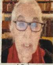
प्रा. रोमिला थापर

शिवाजी विद्यापीठातील विदेशी भाषा विभाग व मराठी अधिविभाग आणि द इंटरनॅशनल सेंटर फॉर साऊथ एशियन स्टडीज, रशियन स्टेट युनिव्हर्सिटी फॉर द ह्यूमॅनिटीज, मॉस्को, रशिया यांच्या संयुक्त विद्यमाने आयोजित तीन दिवसीय आंतरराष्ट्रीय बहुविद्या शाखीय ऑनलाईन परिसंवाद उद्घाटन समारंभाच्या प्रमुख