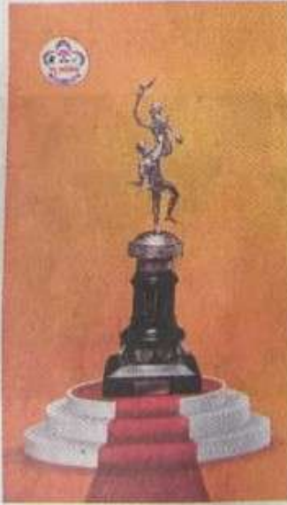
कोल्हापूर : सलग पाचव्यांदा पटकविलेली मेघनाथ नागेशकर ट्रॉफी.

न्यू कॉलेजने २०१९-२० सालची क्रीडा महर्षी श्री मेघनाथ नागेशकर ट्रॉफीवर आपले नाव कोरले आहे. असे जाहीर झाल्याची माहिती शिवाजी विद्यापीठाच्या प्रशासनाने संस्थेला दिली आहे. यावर्षाची ट्रॉफी