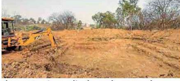
कोल्हापूर : विद्यापीठाच्या पूर्वेला शेततळ्याचे काम सुरू आहे.