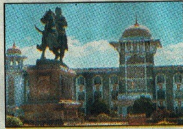
■ मोबाईल टॉवरचा विषय व्यवस्थापन परिषदेसमोर येण्याची शक्यता

तंत्रज्ञानाच्या युगात देशभरातील सर्वच विद्यापीठ व महाविद्यालये वायफाय युक्त झाली आहेत. त्यामुळे शिवाजी विद्यापीठाने जिओ रिलायन्सबरोबर सामंजस्य करार करून विद्यापीठातील विद्यार्थ्यांना माफक दरात जिओची वाय-फाय सुविधा उपलब्ध करून दिली आहे. या करारांतर्गत जिओ १० ते ५० एमबी