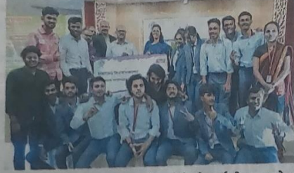
कोल्हापूर : सिंहावलोकन उपक्रमात निपाणीतील केएलई जी. आय. बागेवाडी महाविद्यालयाचा चमू सर्वसाधारण विजेतेपदाचा मानकरी ठरला.