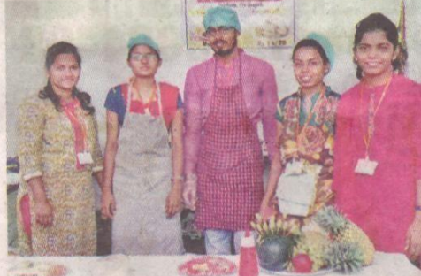
कोल्हापूर : दीक्षांत समारंभानिमित्त आयोजित ग्रंथमहोत्सवात खाद्यपदार्थांचा स्टॉल लावलेले व्यवस्थापन शास्त्राचे विद्यार्थी.

ग्रंथमहोत्सवात अभ्यासक्रम समाविष्ट असलेली तसेच संदर्भासाठी उपयुक्त ठरतील, अशी पुस्तके खरेदी करण्यास वाचकांनी पसंती दिली, तर व्यक्तिमत्त्वासाठी उपयुक्त अशी शेकडो पुस्तके महोत्सवात उपलब्ध आहेत. स्वर्ण