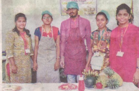
कोल्हापूर: दीक्षांत समारंभानिमित्त आयोजित ग्रंथमहोत्सवात खाद्यपदार्थांचा स्टॉल लावलेले व्यवस्थापन शास्त्राचे विद्यार्थी.

ग्रंथमहोत्सवात अभ्यासक्रम समाविष्ट असलेली तसेच संदर्भासाठी उपयुक्त ठरतील, अशी पुस्तके खरेदी करण्यास वाचकांनी पसंती दिली, तर व्यक्तिमत्त्वासाठी उपयुक्त अशी शेकडो पुस्तके महोत्सवात उपलब्ध आहेत. स्पर्धा