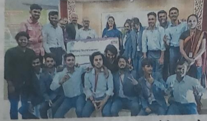
कोल्हापूर : सिंहावलोकन उपक्रमात निपाणीतील केएलई जी. आय. बागेवाडी महाविद्यालयाचा चमू सर्वसाधारण विजेतेपदाचा मानकरी ठरला.