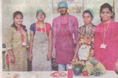
कोल्हापूर : दीक्षांत समारंभानिमित्त आयोजित ग्रंथमहोत्सवात खाद्यपदार्थांचा स्टॉल लावलेले व्यवस्थापन शास्त्राचे विद्यार्थी.

ग्रंथमहोत्सवात अभ्यासक्रम समाविष्ट असलेली तसेच संदर्भासाठी उपयुक्त ठरतील, अशी पुस्तके खरेदी करण्यास वाचकांनी पसंती दिली, तर व्यक्तिमत्त्वासाठी उपयुक्त अशी शेकडो पुस्तके महोत्सवात उपलब्ध आहेत. स्पर्धा