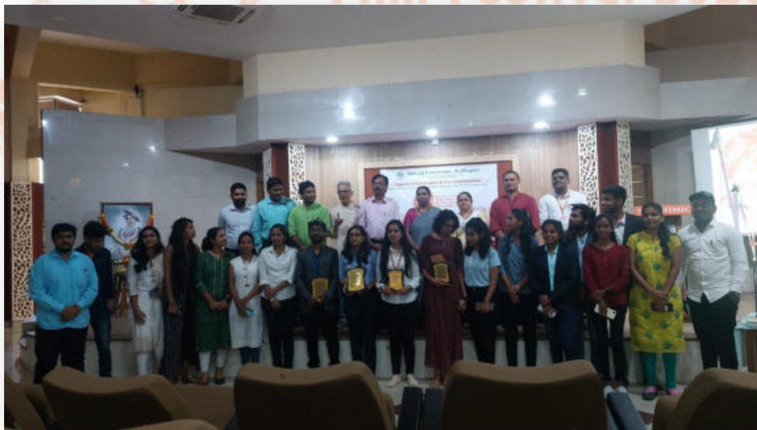
Documentary winners, participants and dignitaries at Rajarshi Chhatrapati Shahu Maharaj National Documentary Film Festival-2023