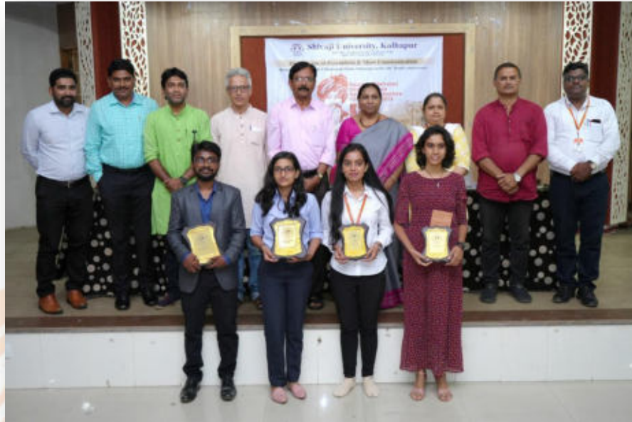
Documentary winners and dignitaries at Rajarshi Chhatrapati Shahu Maharaj National Documentary Film Festival-2023