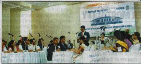
Students participating in the youth parliament

The minister also raised concerns over the rising commercialisation of education across the country. He said